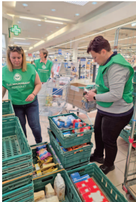
szetesen azt a körülbelül kétszázézer vásárlót illeti, akik segítettek.

Az önkéntesek mellett az összefogásunknak helyet adó kereskedelmi láncoknak és azok dolgozóinak is köszönettel tartozunk. A legnagyobb hála azonban természetesen azt a körülbelül kétszázézer vásárlót illeti, akik segítettek.