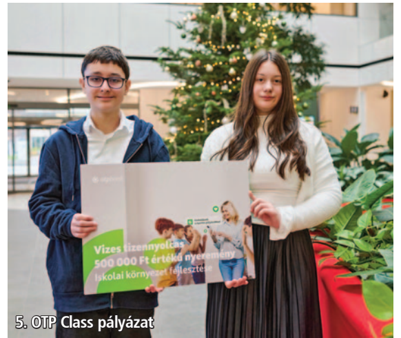
5. OTP Class pályázat