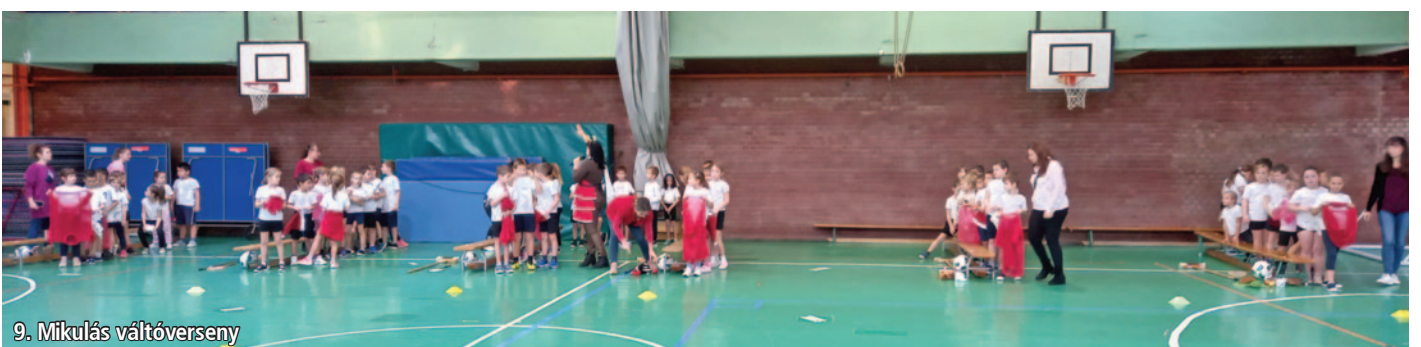
9. Mikulás váltóverseny