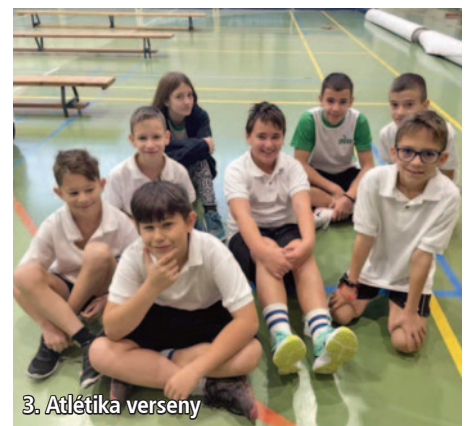
3. Atlétika verseny