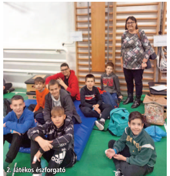
2. Játékos éjszforogató