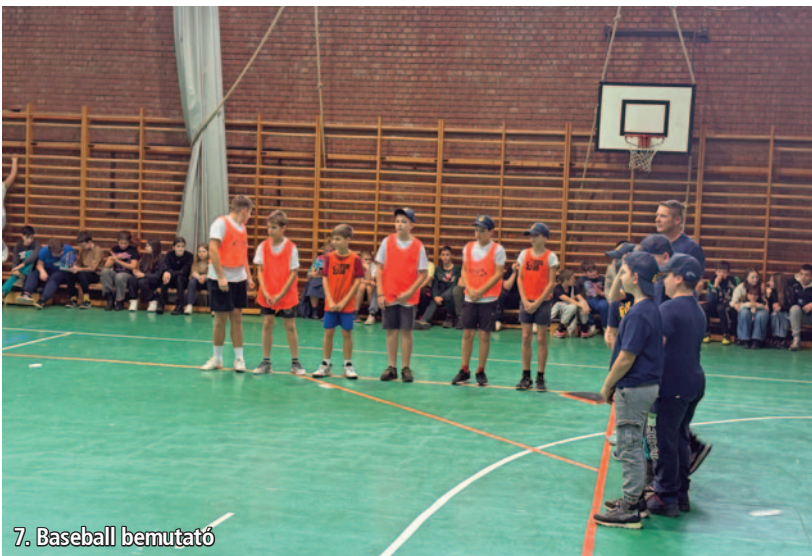
7. Baseball bemutató