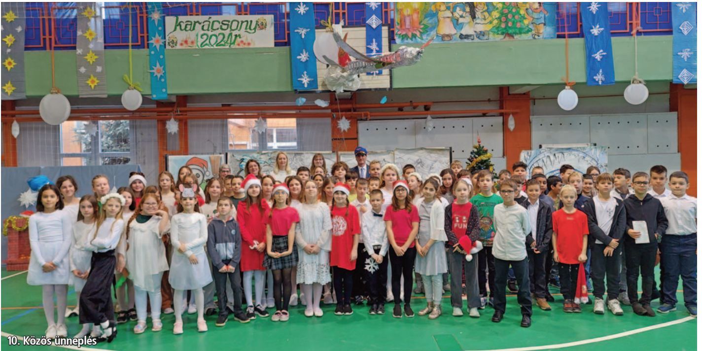
10. Közös ünneplés