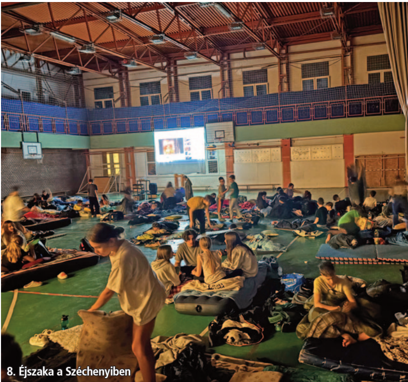
8. Éjszaka a Széchenyiben