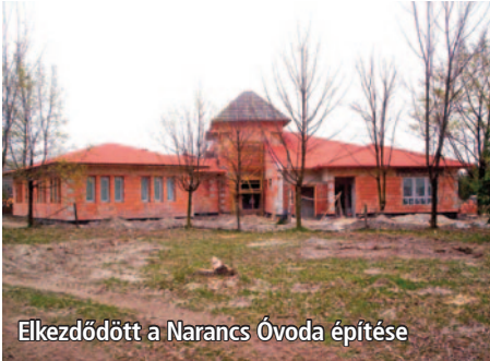
Elkezdődött a Narancs Óvoda építése