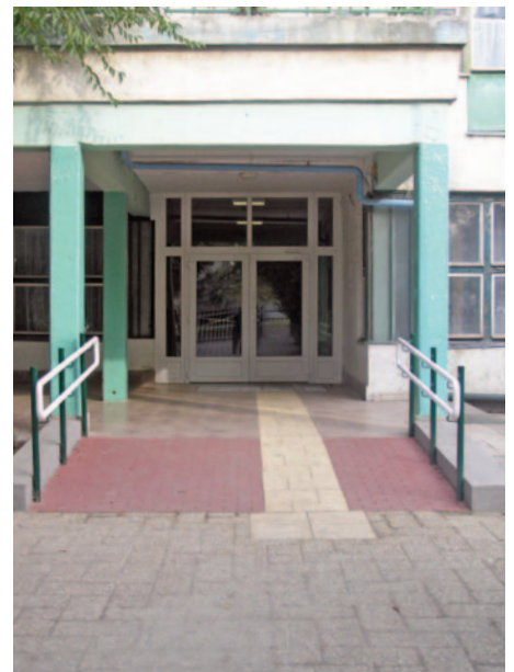
A Széchenyi iskola akadálymentesítése