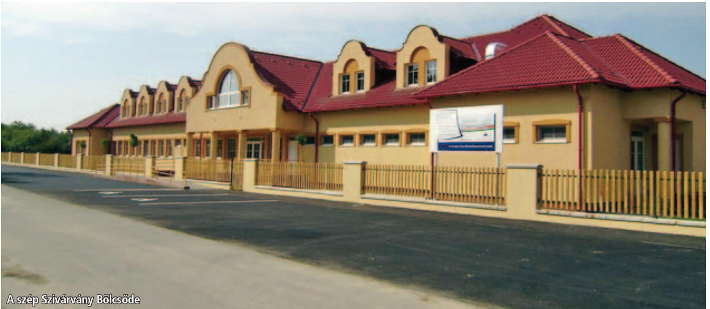
A szép Szivárvány Bölcsőde