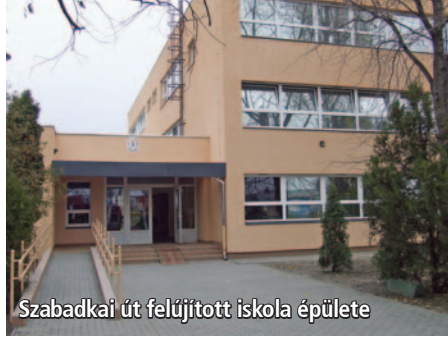
Szabadkai út felújított iskola épülete