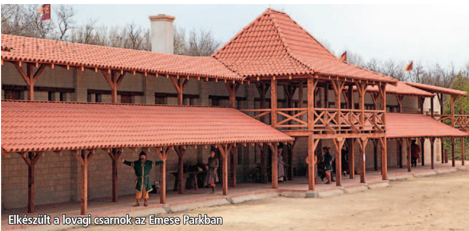
Elkészült a lovagi csarnok az Emese Parkban