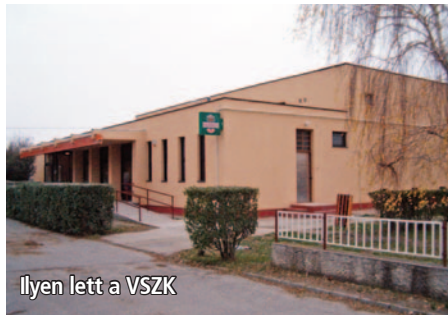
Ilyen lett a VSZK