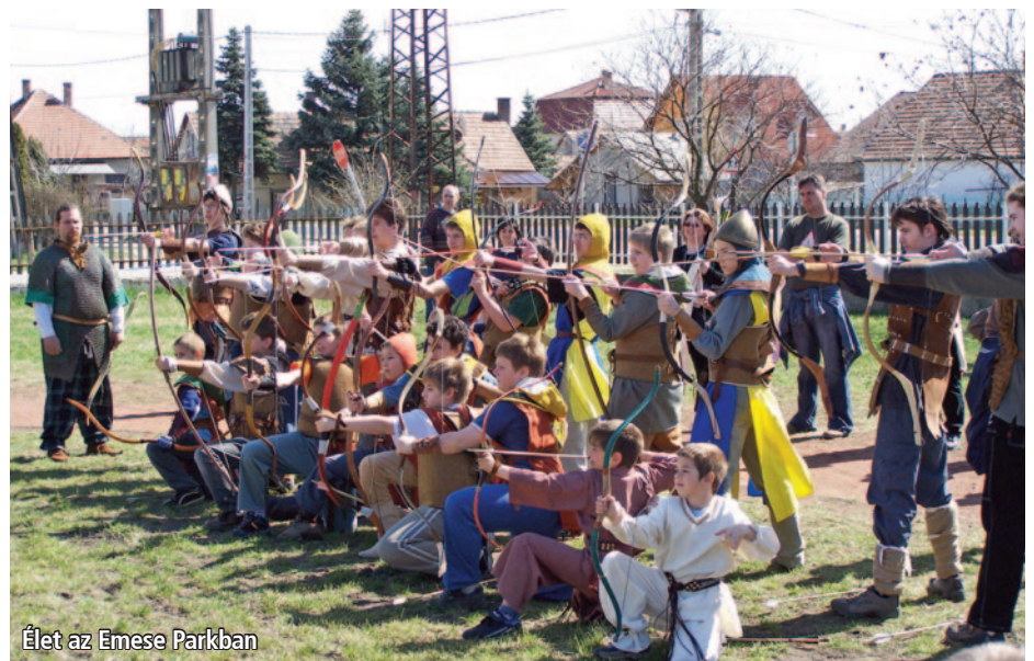
Élet az Emese Parkban