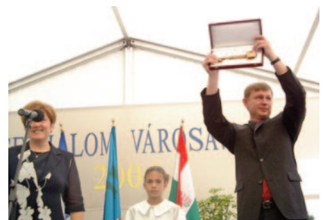
Szigethalom a mi városunk