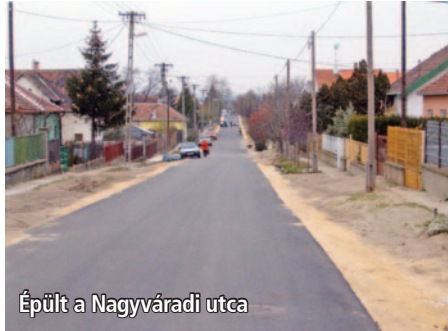
Épült a Nagyvárad utca