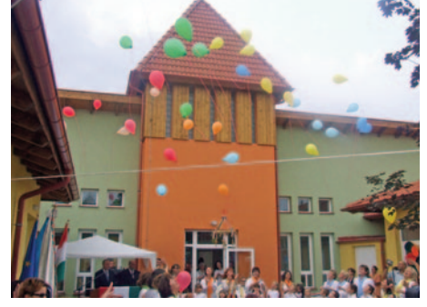
Az óvodások birtokba vehették a Narancs Óvodát