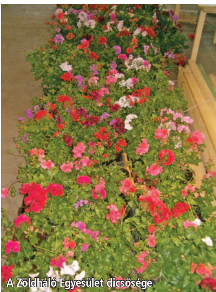
A Zöldháló Egyesület dicsősége