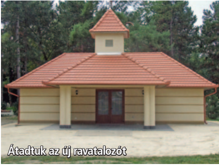
Átadtuk az új ravatalozót