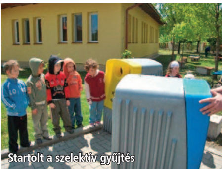
Startolt a szelektív gyűjtés