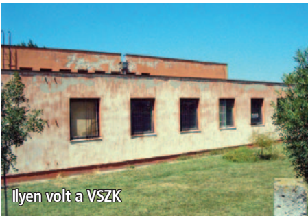
Ilyen volt a VSZK