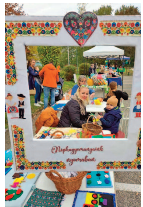
TESZ-Tegyünk Együtt Szigethalomért