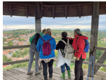
2022 – A nógrádi várban

Második szösszenet: Számptalan helyen járunk szép hazánkban. Olykor közel százan tiportuk az avart, ziháltunk az elhíresült B-lankákon, néztük elkerekedő szájjal és