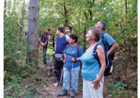
Rácsodálkoztunk a természetre

Számos olyan tömegsportversenyt rendeztünk, mely az egész ország széles sportoló-