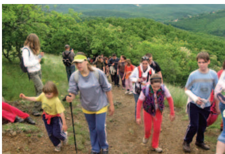
2010 Bükki zihálás

Első szösszenet: Egyesületünk tagsága a klub 25 éves fennállása alatt sok-sok dolgot tartott szem előtt! Köztük is vezető helyen állt, hogy NŐTÁRSAINK is érezzék feljük áradó figyelmünket és tiszteletünket! HÖLGYEK nélkül lehet élni, de minék?