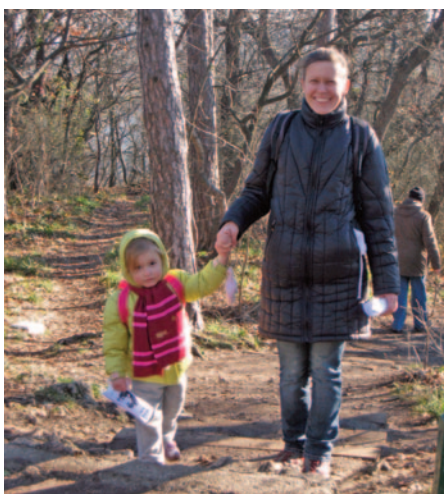
Az ifjúság diadala 2015-ben

Rendezvényeink nyitottak minden természetet szerető, kirándulni és túrázni vágyó számára.