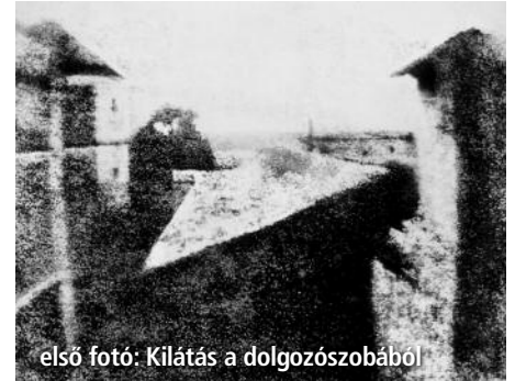
első foto: Kilátás a dolgozószobából

A dagerrotípa a fotográfiában az képrögzítési eljárás volt, amely elsőként gyakorlati használatba került, Louis Daguerre és Nicéphore Niépce fejlesztette ki. Nem volt sokszorosítható, ezért a megmaradt dagerrotípiák egyedi műtárgynak minősülnek. Az ezüstözött rézlemezt polírozták, majd tisztították. Az eljárás sikere teljes mértékben az alaposágon múlt. Ezután jódgőzben – később bróm- vagy klórgőzben – érzékenyítették, amíg a lemez sötétsárga színűvé nem vált. Az érzékenyítéshez speciális fadobozt használtak, amelynek alján porcelán vagy üvegtáblán volt a jód. Sokáig népszerű eljárás volt, annak ellenére, hogy