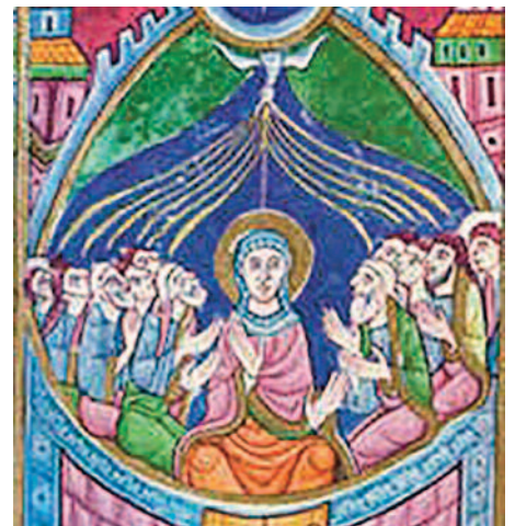
A bibliai jelenet 12. századi ábrázoláson

„Elhozta az Isten piros pünkösd napját, Mink is meghoztuk a királykisasszonykát, Nem anyától lettem, rózsafán termettem, Piros pünkösd napján hajnalban születtem.” Adománygyűjtő népszokás. Szokás volt pünkösd királynét is választani a falubéli kislányok közül. A "királynő" feje fölé kendőből sátrat formálnak a többiek, így járják sorba a falu házait, ahol rózsát, virágot hincsenek az udvarra. Köszöntőt mondanak, mely tulajdonképpen a termékenységvarázslások sorába tartozik. Énekelnek, táncolnak, adományként pedig almát, diót, tojást, esetleg néhány fillért kaptak. Az ismert dal alapján néhol "mavagyonjárásnak" is nevezik a pünkösdölést. ("Ma vagyon, ma vagyon piros pünkösd napja")