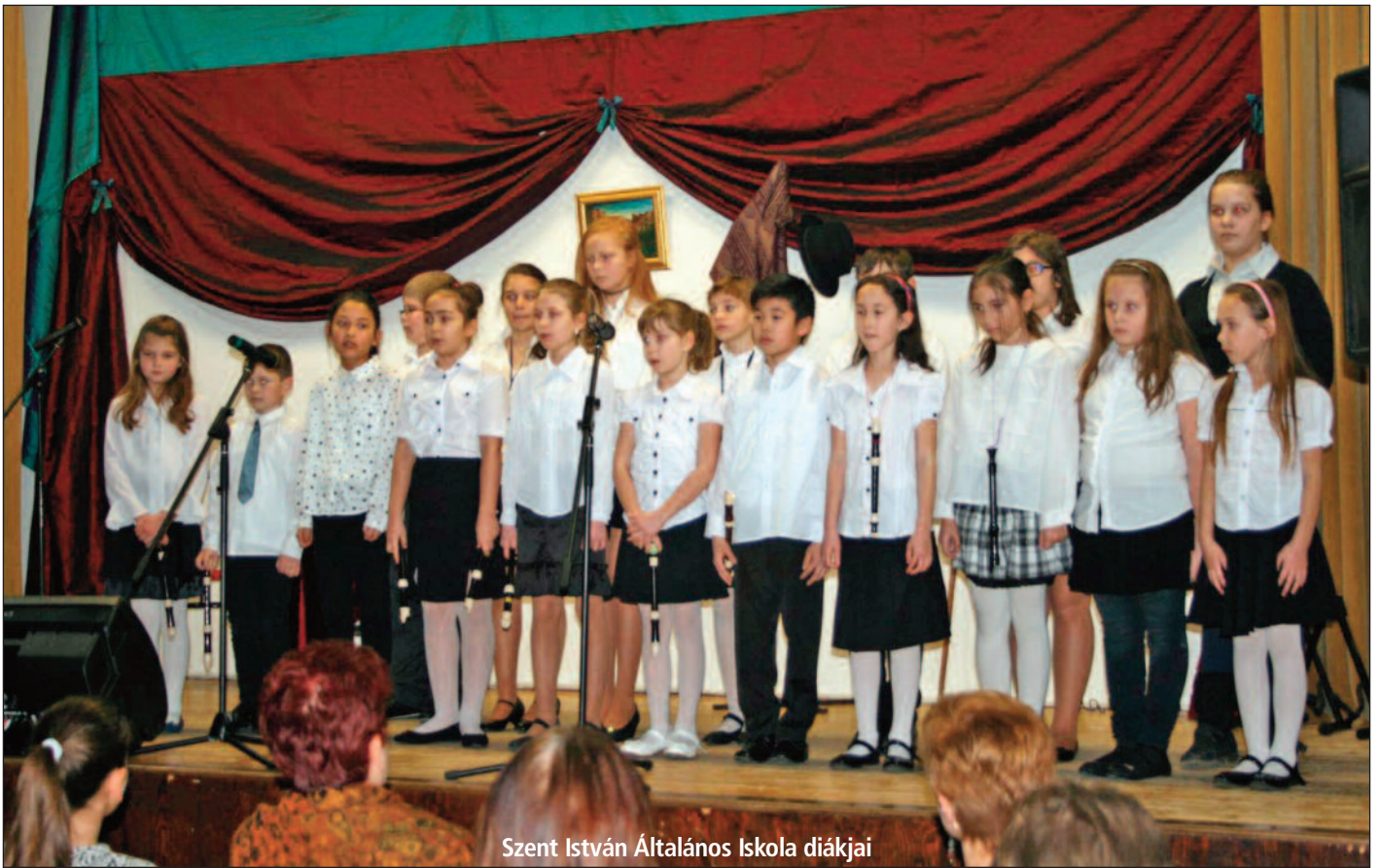
Szent István Általános Iskola diákjai