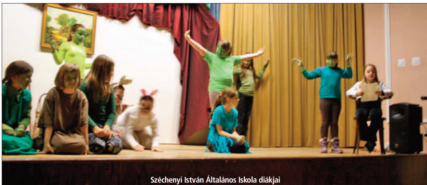
Széchenyi István Általános Iskola diákjai