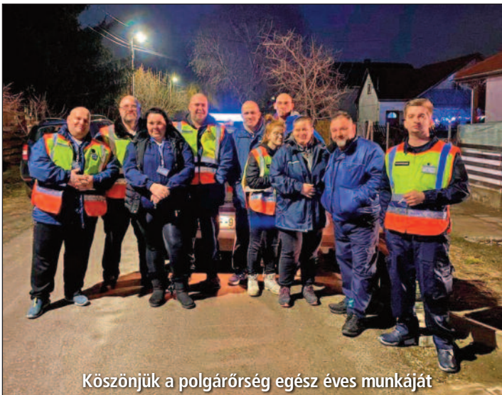
Köszönjük a polgárőrség egész éves munkáját

A Tököli Rendőrőrs telefonszáma új központ kiépítése miatt megváltozott. Az új hívószám: 06/24-520-980