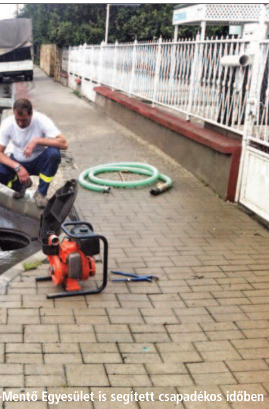
Mentő Egyesület is segített csapadékos időben

Úgy gondolom, hogy a testület többségének fogalma sem volt róla, mi zajlik a háttérben. Nem vették észre, hogy egy-két ember saját érdekei szerint manipulálta őket. Természetesen egy ilyen konfliktusnak csak az újabb választás vethetett véget. Az időközi választást a Fidesz-KDNP-s képviselők nem támogatták, az ezt követő rendes önkormányzati választásokon viszont az engem támogatók kerültek többségbe.