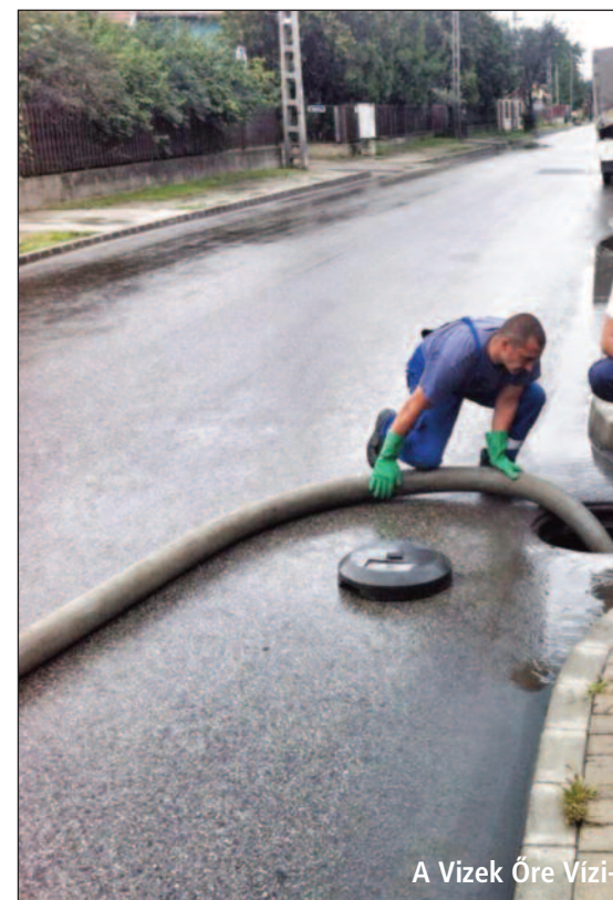
A Vizek Öre Vízi-