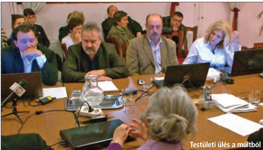
Testületi ülés a múltból

2009-ben és 2010-ben sokat dolgoztunk a városközpont projekt előkészítésén, amelyre több mint 60 millió forintot költöttünk el. Természetesen azt reméltük, hogy ennek az összegnek a nagy részét majd a támogatásból visszakaphatjuk. A koncepció lényege az volt, hogy a sportpálya helyén lett volna a városközpont helyszíne. A Városi Szabadidőközpontot bővítettük volna több helyiséggel, és építettünk volna egy nagyobb színháztermet is. A sportpálya területén pedig egy központi tér jött volna létre, amely körül a későbbiekben ingatlanokat építhettünk volna. Ezen kívül az egészségház környéke újult volna meg, aminek egy részét végül tavaly tudtuk megcsinálni.