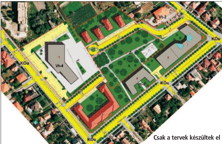
Csak a tervek készültek el