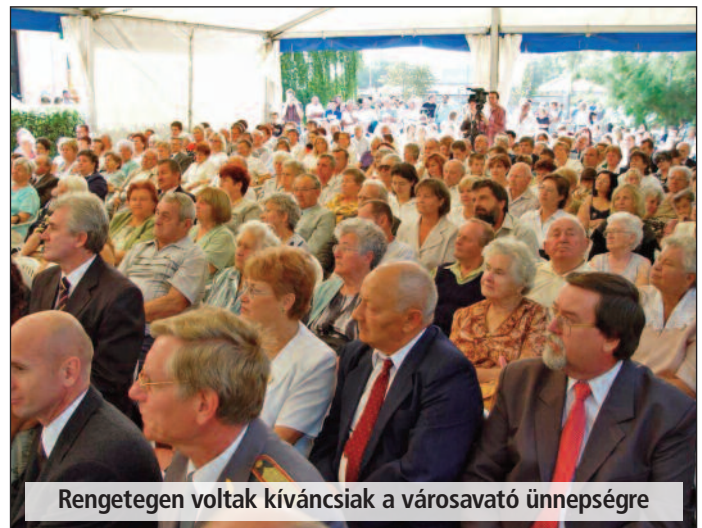
Rengetegen voltak kíváncsiak a városavató ünnepségre