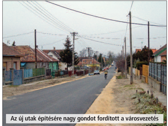
Az új utak építésére nagy gondot fordított a városvezetés