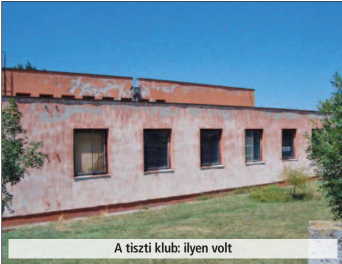
A tiszti klub: ilyen volt