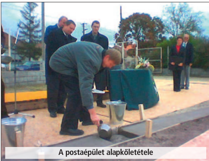
A postaépület alapkőletétele