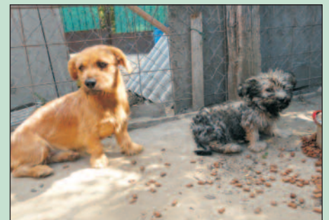
Drótszőrű tacsika, 8 hónapos kisleány, a pici szőrmók mellette egy 8 hetes kicsi lányka

Köszönöm, ha megpróbálnak segíteni az árvákon!