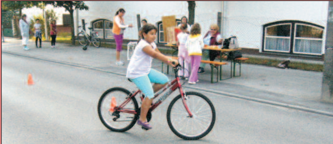
Tizedik évfordulóját ünnepelte az Európai Mobilitási Hét, amelyhez városunk 2010-ben csatlakozott.

Az Autómentes nap alkalmából lezárták városunk egyik legforgalmasabb útszakaszát, a Kossuth Lajos utcát, amit átadtak az ovisoknak, iskolásoknak és minden olyan érdeklődőnek, aki az autó nélküli közlekedést választotta szeptember 22-én. A gyerekek 9 órától folyamatosan vették birtokba a jobbnál jobb játékokat.