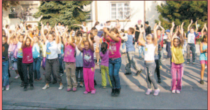
A 2010-es csatlakozás fontos ese-