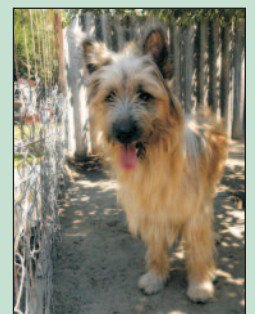
Egy év körüli kan skótzuhász keverék, hetek óta kóborolt Tököl utcáin