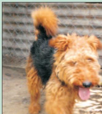
Welsh terrier, 4 év körüli fiú kutyus

A kutyusok mind barátságosak, kedvesek, szeretetre méltóak és kimondottan állatbarát, jólelkű gazdira várnak! Érdeklődni lehet telefonon: 06/20 803-0543 (Enikő).