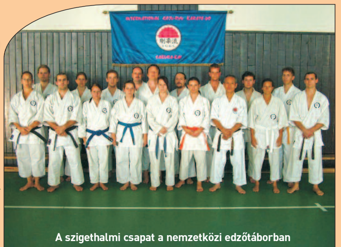
A szigethalmi csapat a nemzetközi edzőtáborban

Abban az esetben, ha egyesületünk felkeltette érdeklődését, szeretettel várjuk edzéseinken!