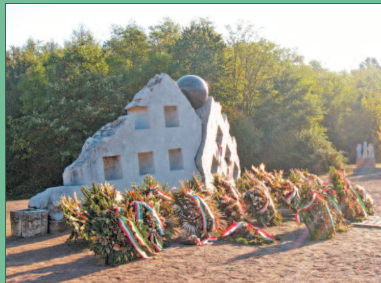
A nemzeti emlékezés koszorúi Recskén