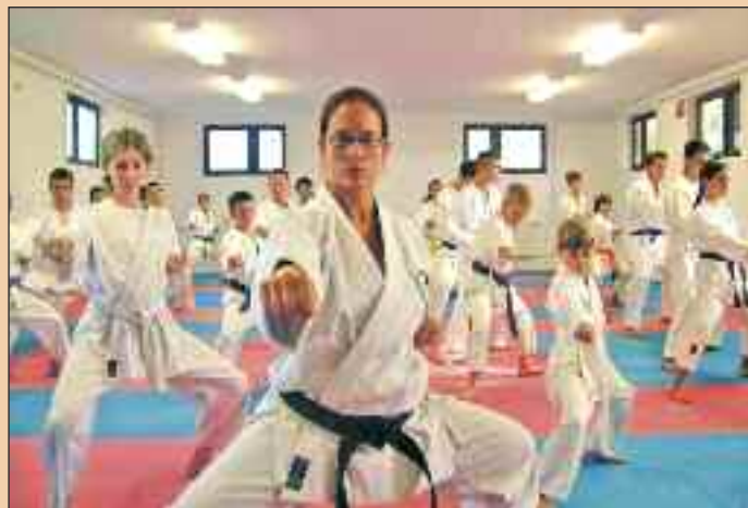
Pillanatkép az övvizsgáról