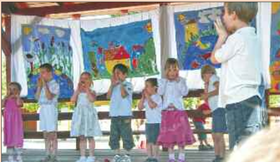
Családi nap az óvodában

Külön meglepetés volt, amikor a gróf Széchenyi Általános Iskola drámaszakköröseinek vegyes csoportja két előadással lepte meg az iskolába látogató óvodásokat: a tanulók Pogány Tibor és Lázár Ervin egy-egy művét mutatták be nagy sikerrel.