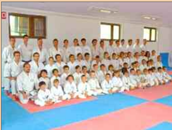
A táborozó csapat

Ezt tartja a karaté szöveg, és azt hiszem, a szigethalmiak hisznek is ebben... Június végén a Seizan KSE tagjai több váltásnyi edzőruhát pakoltak be utazótáskáikba, hogy aztán hét napot töltsenek el Szigetszentmártonban, az Egyesület első önálló nyári edzőtáborában.