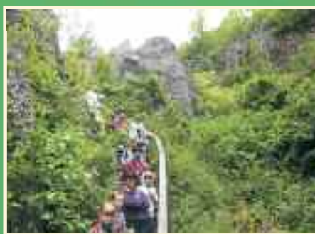
Úrkút, Csárda-hegyi Őskarszt

A leggyorsabb harcosok érmeikkel és kupákkal gazdagodnak. Aki a versenybe benevez (800 illetve 1000 jó magyar forintért) ingyen részt vehet a Vikingtalálkozó egész napos programján. Természetesen egyesületünk tagjainak a nevezés „félpénzes” lesz!