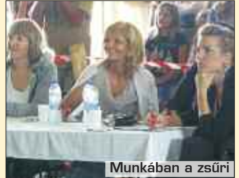
Munkában a zsűri

V árosunk életében mindig nagy esemény az Országos Ikertalálkozó, amikor megszokszorozódik az ikrek száma a környéken. Idén sem volt ez másképp. A 12. alkalommal megrendezett esemény reggel 9 órától várta nemcsak az ikreket, hanem az érdeklődőket is. A találkozót a Dance Land TSE tánc show-ja nyitotta meg, amellyel kezdetét vette az egész napos kavalkád.