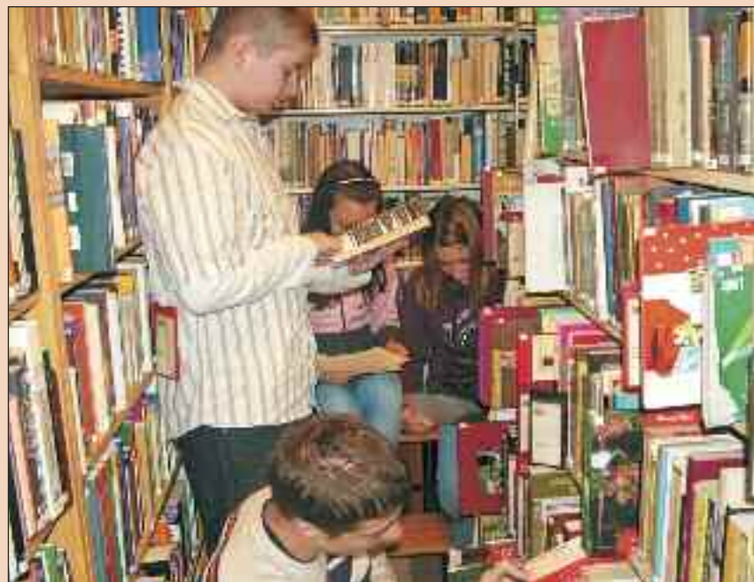
Látogatás a Hegedüs Géza Városi Könyvtárban

bölcsődébe vagy óvodába járnak, mivel így elhelyezkedési esélyeik javulnak.