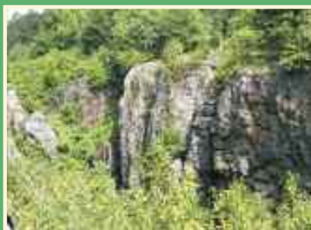
Bakonyerdő, Csárda-hegyi Őskarszt

Szeptember 17-én egyesületünk a Bakony erdő természeti csodáit keresi fel. Ide invitáljuk a természetbarátokat. A táv 20 kilométeres lesz, aminek teljesítéséhez 600 méteres szintemelkedést kell leküzdeni.