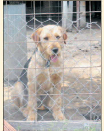
MAX – szintén egy éves ivartalanított foxi-keverék tündéri kutyuska.