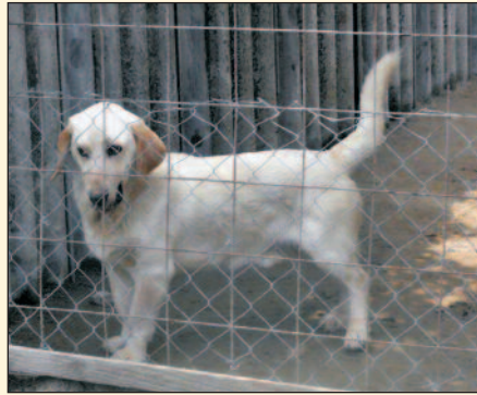
BENDE – egy éves bassethand-labrador keverék fiú kutyuska.

Kérem, csak jólelkű, felelősségteljes gazdik jelentkezzenek az árva kutyusokért!