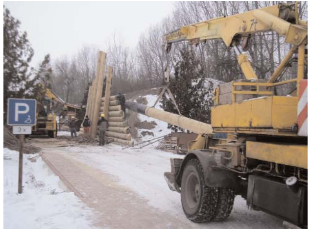
Ha most ugyanezt gépek nélkül kellene csinálni!

képtelenség megoldani a talajszigetelést. Ugyanakkor idő közben megkezdődtek a bejárati kapu elhelyezésének a munkálatai. Mint arról februári számunkban