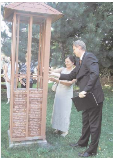
A Gróf Széchenyi István