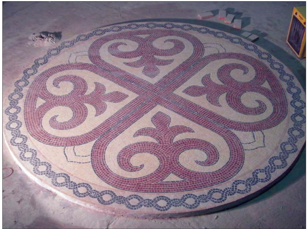
Az elmúlt hetekben megkezdődtek a KMOP támogatásával készülő szigethalmi lovgi csarnok belsőépítészeti munkálatai. A mintegy 800nm-es épület oszlopfőinek kialakítása közben elkészült az a négy méter átmérőjű mozaik is, amelynek mintázata a korabeli motívumvilágot tükrözi. Néhány hónap múlva az érdeklődők már a helyszínen tekinthetik meg az elmúlt évtizedek egyik legizgalmasabb hazai turisztikai vállalkozásának az eredményét

"A rendőrség nem csak szolgál és véd, kapcsolatot és jövőt is épít!" - Ezt a célt szolgálja a város közoktatási intézményeiben második éve megrendezésre kerülő "Iskola rendőre" program, amely elősegíti a rendőrség által a gyermekek felé irányuló átfogó bűn- és baleset-megelőzési tevékenységet. A program keretén belül látogatott el iskoláinkba januárban a NARCONON MAGYARORSZÁG ALAPÍTVÁNY, amely hasonlóan a nemzetközi szervezethez, oktatások során drogmegelőzéssel is foglalkozik. Az alapítvány munkatársai a hatodik évfolyamos tanulók részére tartottak felvilágosító előadásokat. Az alapítvány célja olyan drogmentes környezet megteremtése, ahol a drogfogyasztás minimális, a drogokkal kapcsolatos bűnözés már nem mérhető, az emberek a problémáikat megoldják, és nem menekülnek a drogok homályos világába. "A te felelősséged! Ha nemcsak szülője, de barátja is vagy gyereked-