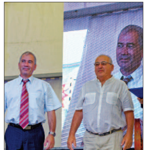
folytatás a 3. oldalon

A szigeten az ő segítségével épült ki az esővízelvezetése a Dunába, amit, sajnos, azóta elvágtak. Tizenöt évvel ezelőtt kezdeményezte – a Dunaszigeten élő többi lakóval közösen –, hogy minden március 15-e körül kitakarítják a szigetet, amit a mai napig aktívan folytatnak. A szigeti lagúna hídjai alatti részek rendbetételét is szívén viselte, és nemcsak a munkával segített, hanem a zsalukövek meghozatalával is. Dörfler Zsolt régóta rendszeres támogatója az