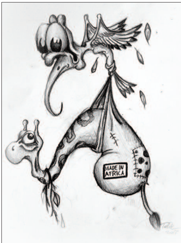
Tóth Bence: African souvenir