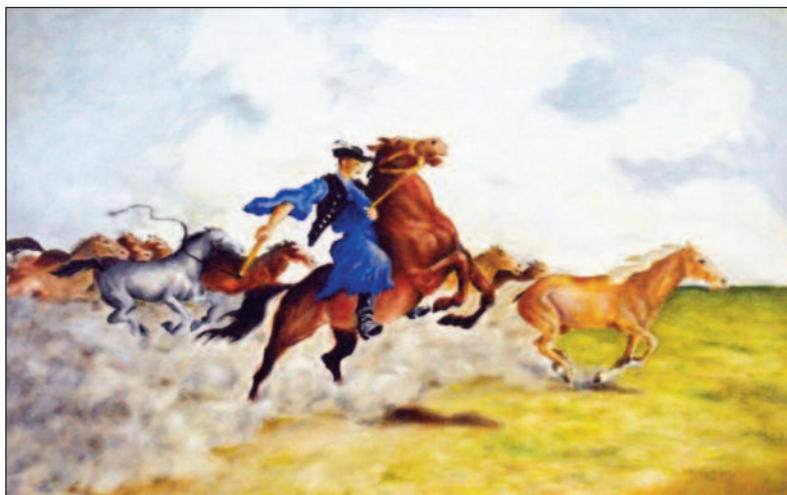
Csapó Lajos: Robog a ménés