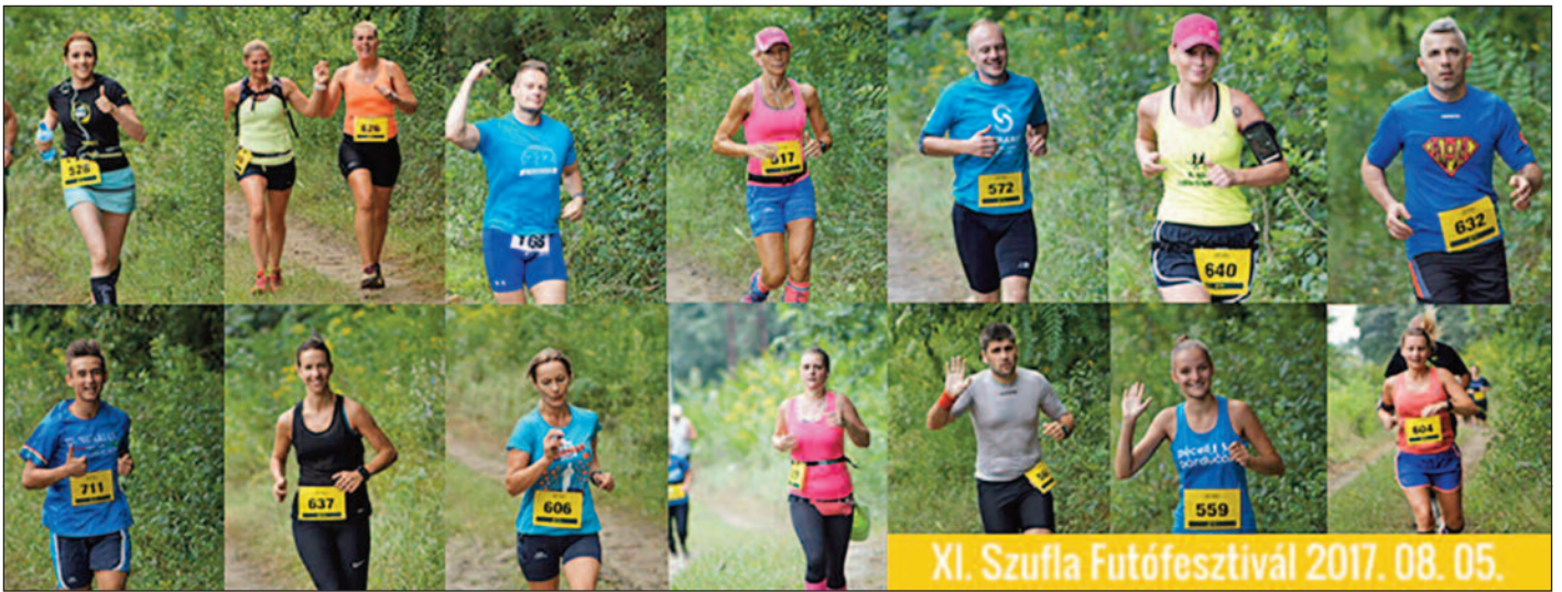
XI. Szufia Futófesztivál 2017. 08. 05.