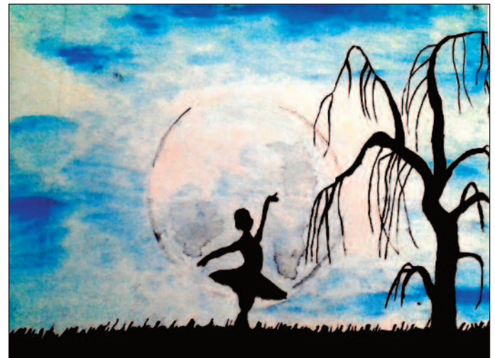
Antal Szofi 5. o. Táncos gyöngy technika PEMZLI SULI