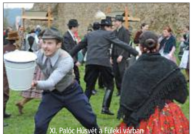
XI. Palóc Húsvét a Füleki várban