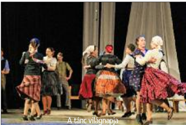
A tánc világnapja

számít, hiszen egyebek között megélhetési forrásként is fontos. A legtöbb turistát nyilván a vár és a vármúzeum vonzza, a tavalyi évet az építkezések miatt részlegesen lezárt területek ellenére is rekordszámú látogatottsággal zártuk, 23 550 fizető látogatót számláltunk. A ferences kolostor szerzeteseivel karöltve igyekszünk a város másik műemlékét, a barokk római katolikus templomot is – amelyben a közelmúltban fejeződött be a freskók restaurálása – teljes szépségében bemutatni a turistáknak. Ugyanakkor a lehetőségeinkhez mérten, főleg a kétnyelvű önkormányzati havilapunk és honlapunk ( www.filakovo.sk ) segítségével, felhívjuk a figyelmet a városképet gazdagító többi műemlék jellegű építményre is, melyek közül az egyiket, a neobarokk stílusú Berchtold-kastélyt a szintén uniós finanszírozással revitalizált városi park veszi körül. Idegenforgalmi szempontból érdekesnek tartom a Pincesor Polgári