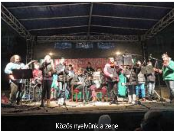
Közös nyelvünk a zene