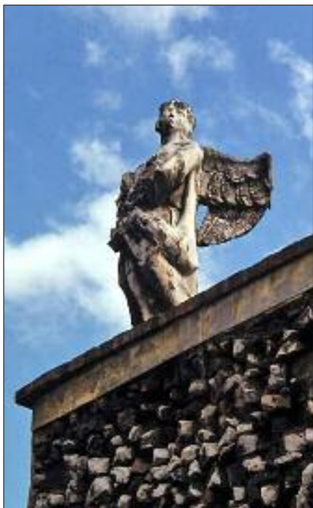
Csúf Angyal - szobor Erdélyben

Bujkáló dalt játszik a nap, s ősz piktora erőre kap. Színeket fest tájtáblára, harmatgyöngyöt fű szálára. Mennyek kékjét ég boltjára, szürke subát kis bojtárra. Légben szálló pillangókat, tova úszó szép hattyúkat. Erdők örök leheletét, holdsugárfény üzenetét. Csillagzáró ezüst nyilát hajnal hasad: s ébred a világ.