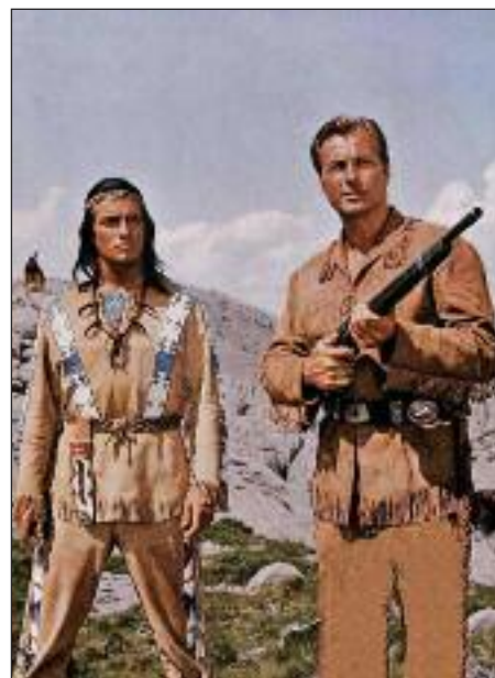
A könyvek alapján készült ismert német filmek főszereplői