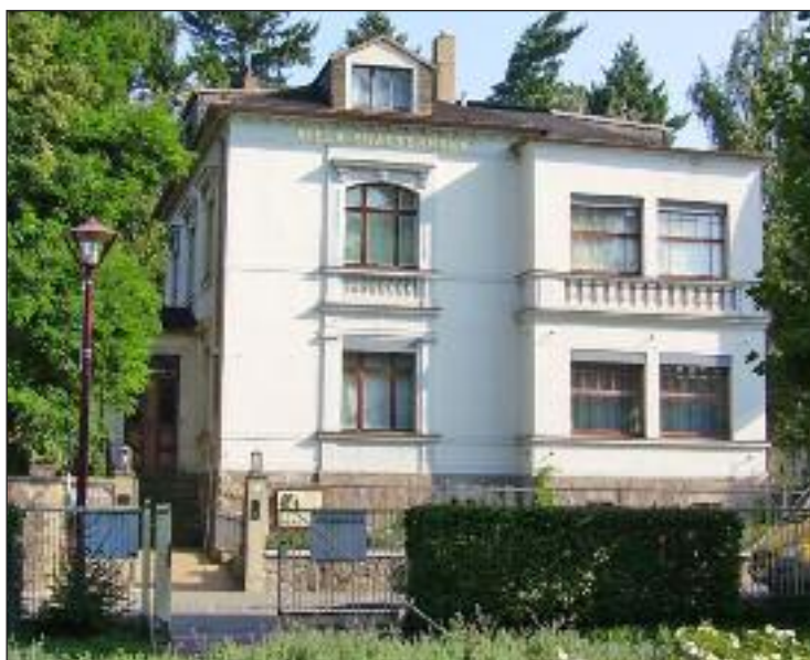
A Karl May múzeum egyik épülete: a Shatterhand Villa