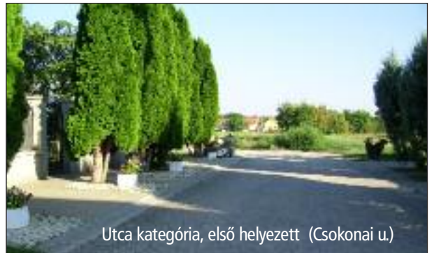
Utca kategória, első helyezett (Csokonai u.)