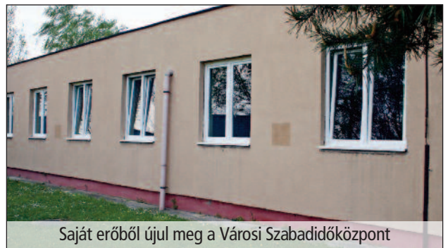
Saját erőből újul meg a Városi Szabadidőközpont