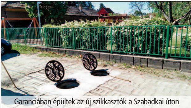
Garanciában épültek az új szikkasztók a Szabadkai úton

Mint ígértem, az újság hasábjain továbbiakban is tájékoztatom a lakosságot az önkormányzat aktuális ügyeiről. Hogy milyen témák kerülnek be egy-egy cikkbe, azt a hozzám érkezett visszajelzések alapján tudom összegyűjteni. Ezért arra kérem az olvasókat, hogy ha valamilyen kérdés felmerül bennük, juttassák el a mail címre aktualitások tárgygyal, és én megpróbálom legjobb tudásom szerint válaszolni.