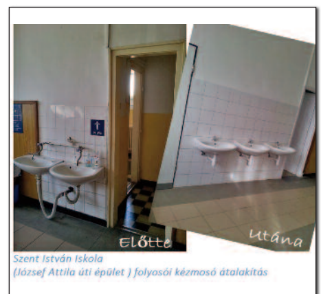
Szent István Iskola (József Attila úti épület) folyosói kézműso átalakítás