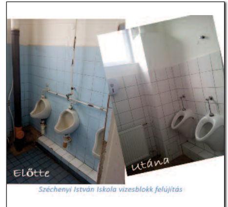
Széchenyi István Iskola vizesblokk felújítás