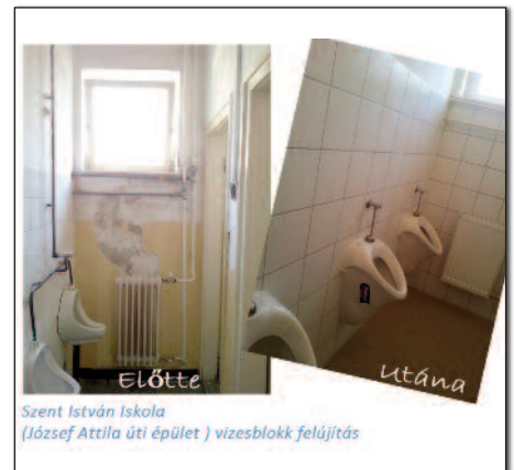
Szent István Iskola (József Attila úti épület) vizesblokk felújítás