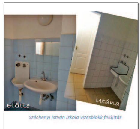
Széchenyi István Iskola vizesblokk felújítás