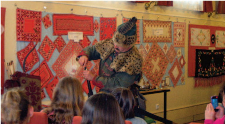
Kuruc vitéz munkában

A Szigethalmi Széchenyi István Általános Iskolában 2015. június 22-én (hétfő) de. 9 órakor kerül sor a tanévzáró ünnepélyre, amelyre szeretettel várjuk vendégeinket.