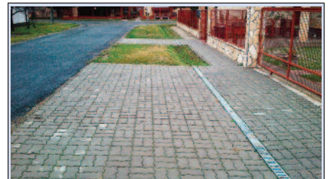
A képen egy jól elkészített burkolást láthatunk

Helyszíne: 2315 Szigetalom, Szabadkai utca 239.