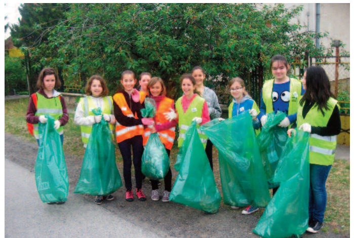
Vidáman bezsákoztuk az ellent.