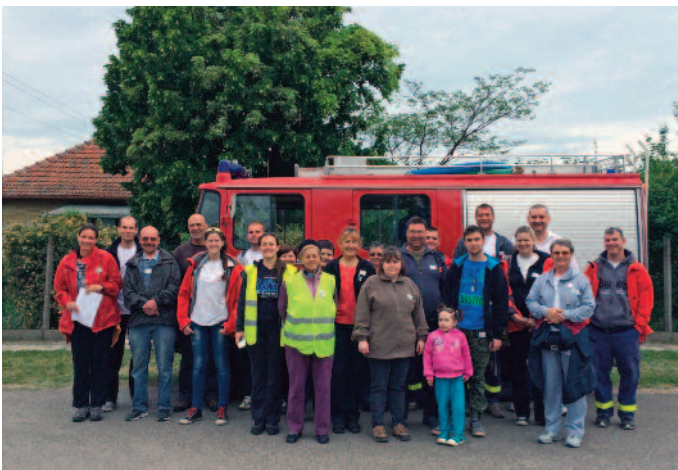
A szombati csapat