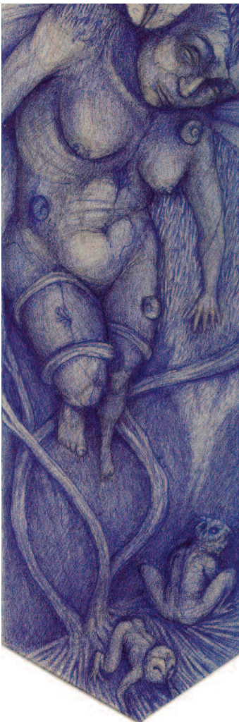
Radics Márton: Könyvjelző