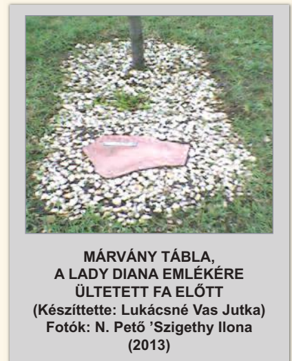
MÁRVÁNY TÁBLA, A LADY DIANA EMLÉKÉRE ÜLTETETT FA ELŐTT (Készítette: Lukácsné Vas Jutka) Fotók: N. Pető 'Szigethy Ilona (2013)