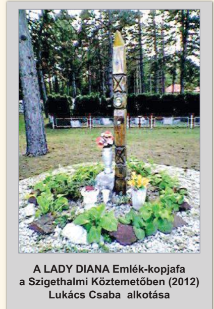
A LADY DIANA Emlék-kopjafa a Szigethalmi Köztemetőben (2012) Lukács Csaba alkotása