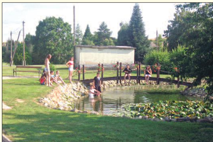
Kis tavacska Feked közepén

Aki szeretne mélyebben megismerkedni a faluval, kicsit alámerülni a „boldog békeidők” világába, azt már július 4-én várjuk. Akinek megtetszik a „sváb Hollókőnek” is nevezett falu, az július 7-ig maradhat. A sátorozás díja 500 Ft/fő. (Van zuhanyzásra lehetőség, plazmatévé – elvégre foci VB van, saját kemence, óriás sakk, saját bejárható focipálya).