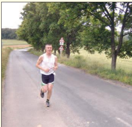
A hosszútávfutó magányossága