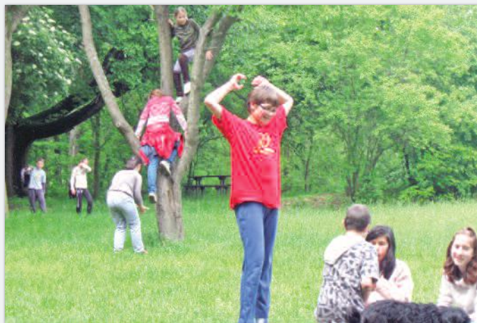
Parkerdők és a játék