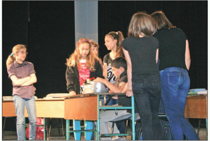
„A gyermekek azért látják a varázslatot, mert keresik.” (Christopher Moore)