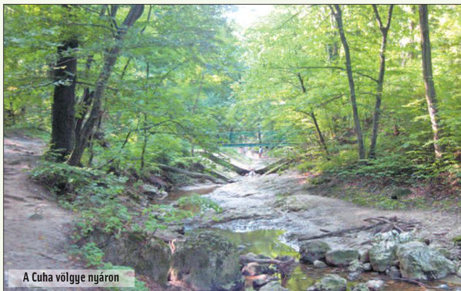
A Cuha völgye nyáron

F ebruár 22-én egyesületünk tagjai részt vesznek a Ha-Vas-Paripa teljesítménytúrán. Szeretettel várunk mindenkit, aki szeret szép környezetben, nemes célért sportolni.