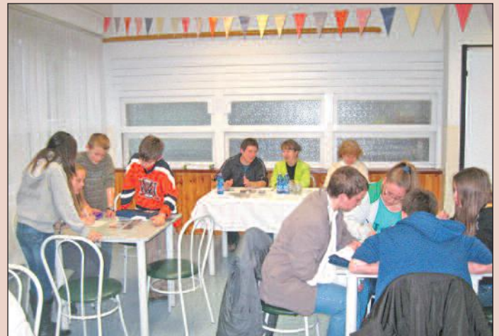
A csapatok és a zsűri