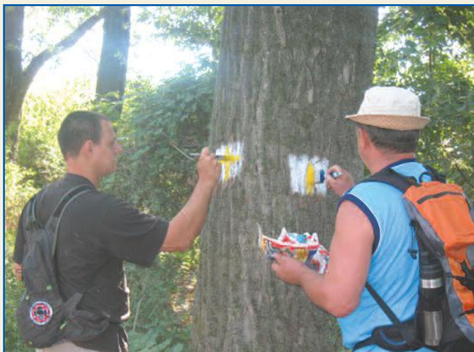
Munkában a jelzéstestő önkénteseink

Köszönjük több mint 100-an; azért „vagyunk”, hogy népszerűsítsük a tömegsportot, olcsó sportolási, országjárási lehetőségeket biztosítsunk Szigethalom polgárainak. Jó érzés tudni, hogy odafigyelnek ránk, egy aktív és hasznos közösségnek tartanak bennünket.