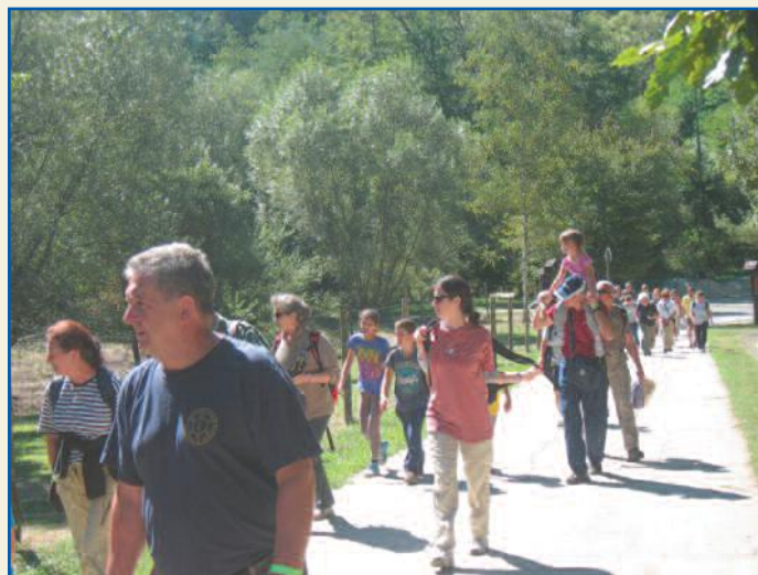
Szigethalmiak áradata Ipolytarnócon

Ilyenkor azt szokták „mondani”: „Nem a dicséretért csináljuk!” Ez szerintem csak részben igaz, mert a lelkesedés legjobb táplálója az elismerés. No, ezt mi megkaptuk! Ez kötelez minket arra, hogy továbbra is lelkesen és önzetlenül szervezzük versenyjeinket, járjuk vidám, lelkes természetbarátainkkal hazánk tájait.