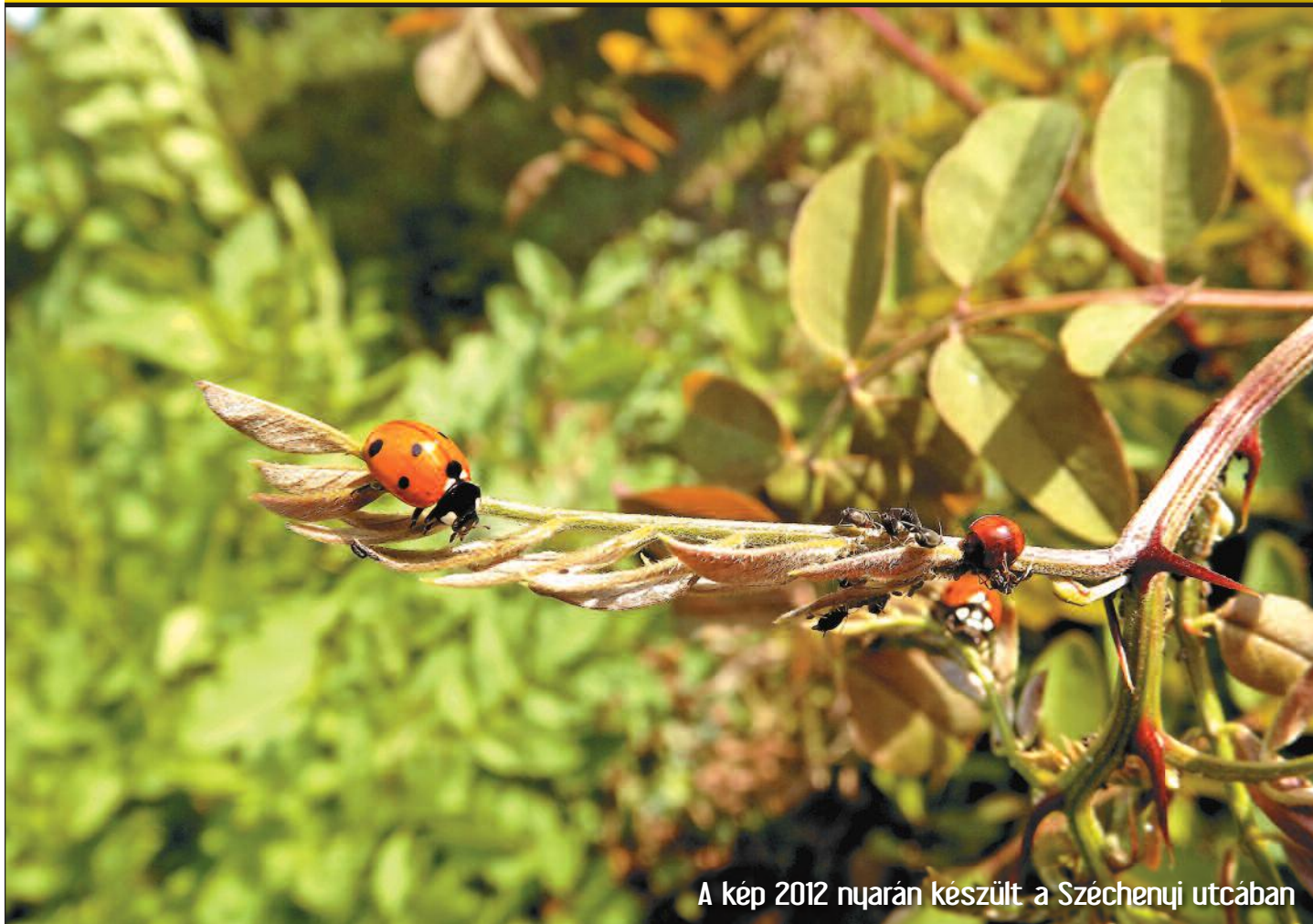
A kép 2012 nyarán készült a Széchenyi utcában