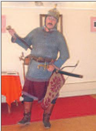
Becsörömpölt a mester