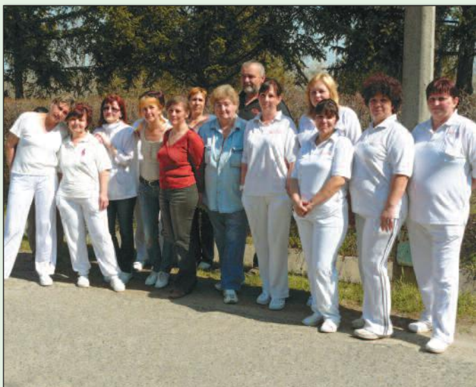
A SZENI dolgozói

Gazdasági értelemben egyszerű a képlet. A normatíva és a társulásban résztvevő önkormányzatok hozzájárulása legtöbbször nem fedezte a tényleges költségeket, így Szigethalomnak ezt saját forrásaiból kellett kiegészítenie, amit lehetett volna másra is fordítani. Voltak olyan ellátási területek, amelyeket nem kért a társulásban résztvevő többi önkormányzat, így ezeket a városnak saját forrásból kellett finanszíroznia. Az én feladatomban az, hogy azokat az önként vállalt