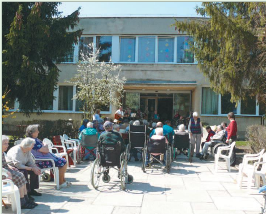
Szigethalom Egyesített Népjóléti Intézmény

feladatokat, amelyeket az önkormányzat a szociális ellátás területén fenntartani kíván, olyan gazdasági menedzseléssel tartjuk fent, hogy az önkormányzatnak ne kelljen annyi támogatást hozzáadnia. Ez ebben az évben még nem biztos, hogy látszani fog, mivel én már egy adott költségvetéssel dolgozom, de szeretnék benyújtani egy módosított költségvetést. Az idősothonban például nagyon sok olyan idős ellátott van, akik nem szigethalmiak. Esetükben nem biztos, hogy a mi önkormányzatunknak kell a személyi térítési díj és a tényleges költségek közötti különbözetet megtérítenie. Most jelenleg a teljes ellátási díjnak csak a 80%-a van fedezve, a többit Szigethalom Város Önkormányzata állja.