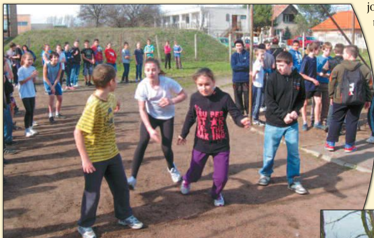
• • • A váltás pillanata • • •

Nos, nálunk, a Szent István Általános Iskolában azt tapasztaljuk, hogy jó programok, hangulatos versenyek megszervezésével könnyen és hamar elcsábulnak nebulóink egy remek kis „átmozgatásra”. Álljon itt két, veretes példa.