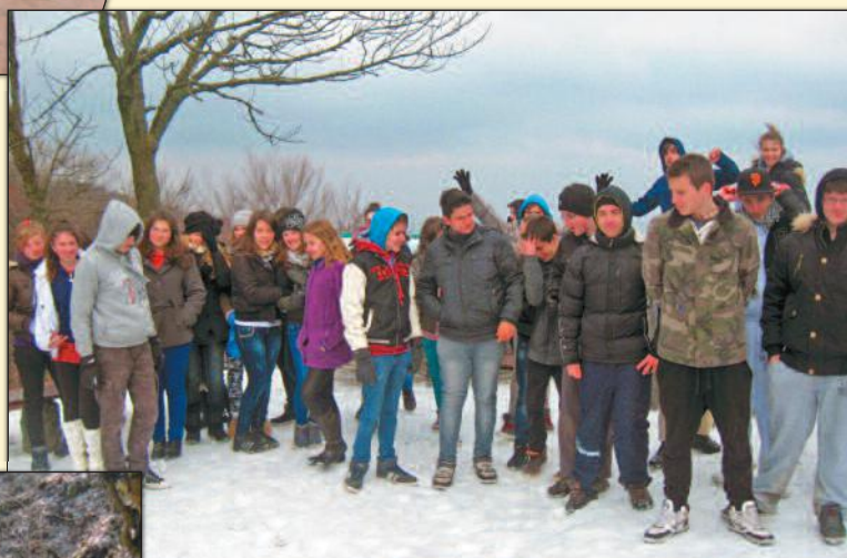
• • • Dobogókői kupac • • •

Biztos vagyok benne, hogy a heti 5 testnevelés óra bevezetése jó döntés volt. Abban is biztos vagyok,