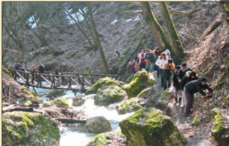
• • • Vigyázz, csak libasorban! • • •

ramok, iskolai ünnepélyek alkalmával a természetben. Egészséges környezetben, a csodás magyar tájban, ezredéves épített