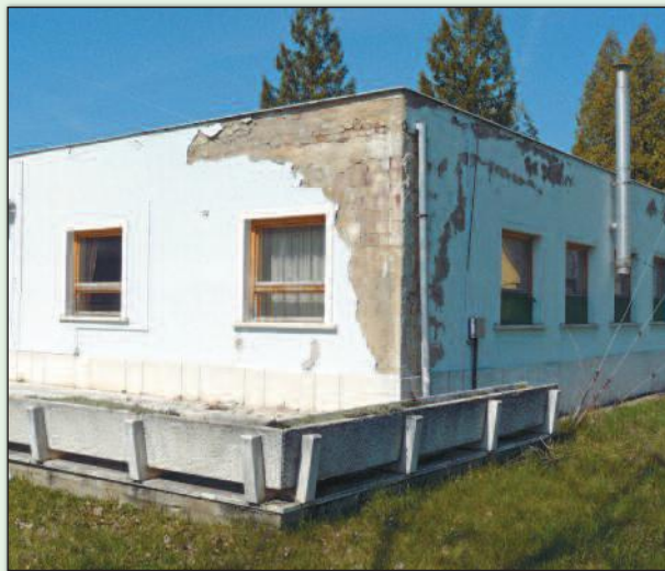
A romos állapotú nappali ellátó

Annak idején, amikor ez a létesítmény megalakult, egy laktanyából kellett létrehozni ezt a mostani intézményt. Nagyon izgalmas feladat volt szakmailag végigkísérni az idősotthon születését. A közel egy évtized alatt szépen kinőtte magát az intézmény, hozzánk került ugyanis az egészségház üzemeltetése, a központi orvosi ügyelet ellátása, a családsegítés, a támogató szolgálat megszervezése, a jelzőrendszeres házi segítségnyújtás, és még ápolási intézet is létrejött az épületen belül, ami Pest megyében egyedülálló volt. A kellemes emlékek számomra elsősorban azok, amelyeknek az idősek örültek. Ilyen volt az évenként megtartott Pest megyei Idősek Találkozója, ami több ezer érdeklődőt vonzott. Fontos volt az is, hogy be tudtunk kapcsolódni a szakmai képzésekbe. Ennek keretében több idősotthon vezetőjének tartottunk képzéseket, egészségügyi dolgozók továbbképzéseit szerveztük meg. Az ezekből származó bevételek biztosították jórészt az idősotthon és az ápolási intézet működési