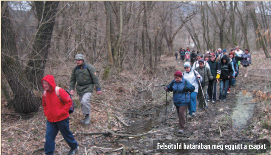
Felsőtold határában még együtt a csapat

Az elmúlt hetekben 2 alkalommal is büszkeség töltött el egyesületedet, a Szigethalmi TE sportolóját a teljesítményét látva.