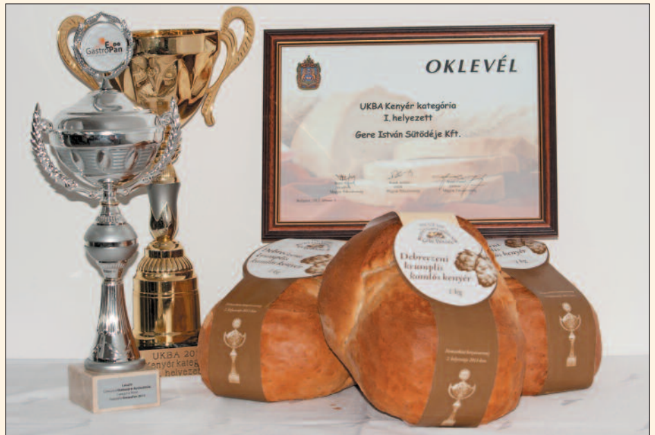
Debreczeni krumplis komlós

A versenyre az ország számos pontjáról érkeztek pékmesterek, akik szebbnél szebb és finomabbnál finomabb termékekkel emelték a verseny színvonalát. Összesen 18 kenyér indult a kenyér kategóriában. A versenykiírás szerint a győztes kenyér lesz az idei év Szent István napi ünnep kenyere, így az ország számos pontján a győztes kenyeret fogják sütni. A 18 kenyér közül a Szigethalmon működő Gere Pékség által gyártott Debreczeni krumplis komlós kenyér nyerte a kenyér kategóriát. A választás azért esett erre a kenyérrre, mert egyrészt 2011-ben Marosvásárhelyen 2. helyet ért el a nemzetközi kenyerversenyen, másrészt a kenyér térségünkben továbbra is igen népszerű a vásárlók körében.