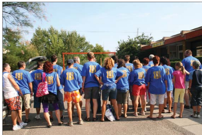
...és hogy jól lássák, mit is képviselünk