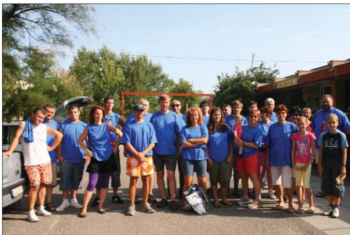
Sárkányok előlről, semmi extra...

SZIGETHALMI LOKÁLPATRIÓTÁK LELKES CSAPATA RÉSZT VETT RÁCKEVÉN A MÁR HAGYOMÁNYOS SÁRKÁNYHAJÓ VERSENYEN. JÓ IDŐ, JÓ HANGULAT, NAGY KÜZDELEM, TISZTES EREDMÉNY, RÖVIDEN A NAP MÉRLEGE.