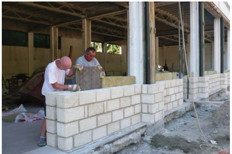
A régi kort idéző falrendszerbe modern hőszigetelés kerül

gárának felhasználásával készül. A XX. század oly népszerű technológiájával készült betonkolosszus átalakítása után csaknem egy ezredévvél röpit majd vissza minket az időben: az épület kívül-belül középkori jelleget kap, miközben korunk elvárásainak (pl. tűzvédelem, mozgássérültek által támasztott igények) is megfelel majd. A csarnok közepén nagy bemutatóter lesz, ahol az előadások zajlanak. A nézők két helyről is követhetik az eseményeket. A földszinten rönkpadok és -asztalok sorakoznak majd, míg az ülőhelyek fölött galériát alakítanak ki. Az épület egyik érdekessége lesz, hogy a nézőtér kifelé is megépül, így egyszerre akár két helyszínen, a csarnokon belül, illetve a vár előtti nagy küzdőtérre is lehetnek látványosságok. Télen a belső tér fűtését két nagy cserépkályha biztosítja. A vár a lovagi tornák, i-jászbemutatók, középkori mutatóanyagok felvonultatása, stb. mellett időszakos és állandó kiállítások tartását is lehetővé teszi. Így a látogatók közelről is megtekinthetik eleink fegy-