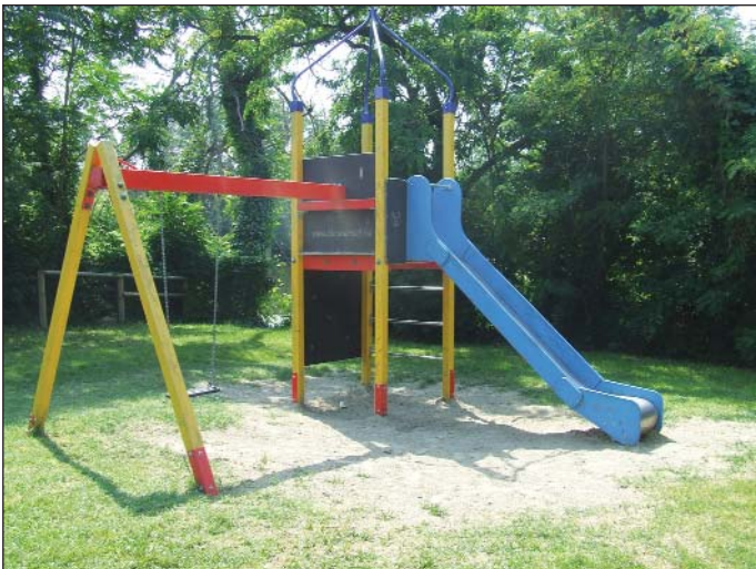
Már csak ez maradt a gyerekeknek

gatnom a szülőktől. A panaszokkal sok kis gyermekes szülő irt levelet illetve, személyesen panaszolta el, az itt uralkodó állapotot az önkormányzatnak, és nem történt