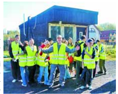
Munkára, harcra készen