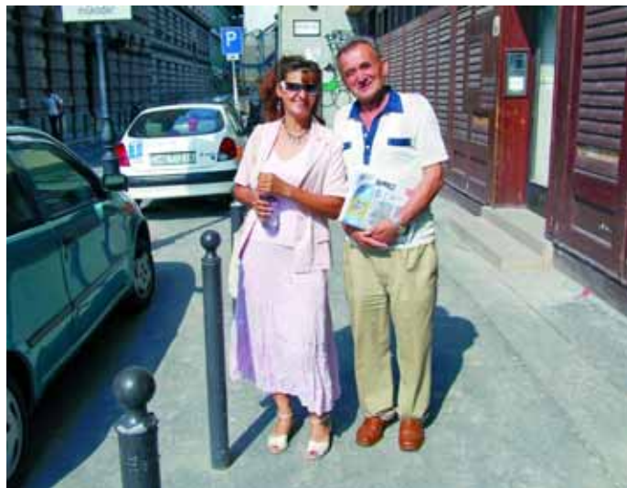
2007. Budapest, Költészet Napja