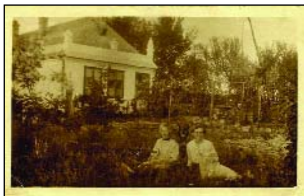
A Csorfas ház...a feltételezett hely