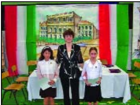
Rájuk a névadó is büszke lenne...