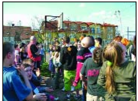
Vajon ki lesz majd a győztes?...