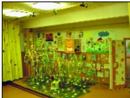
A szépen feldíszített Húsvétfa