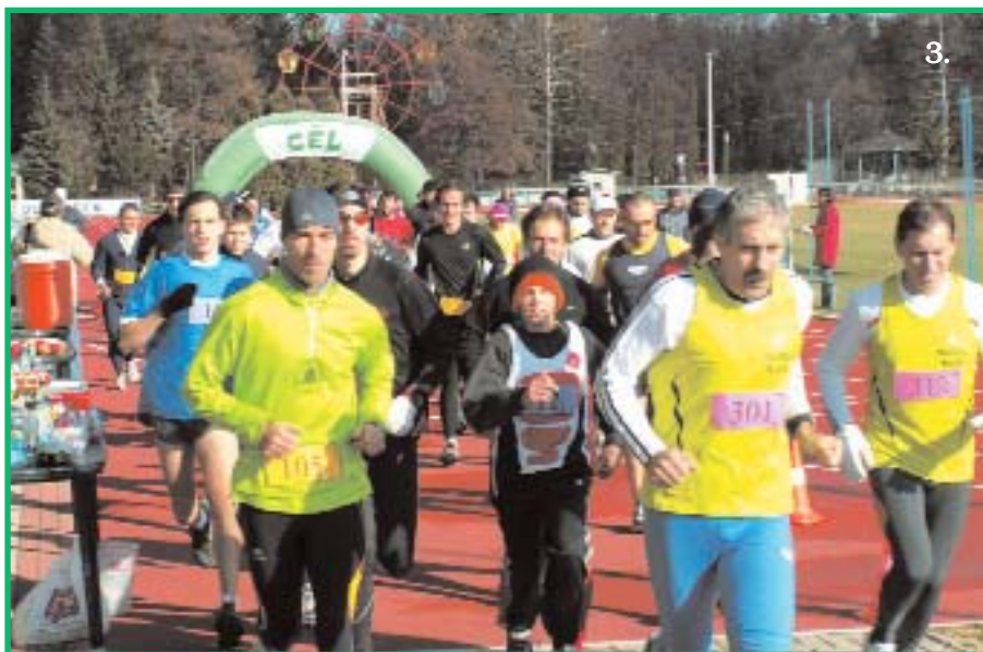
1-2. Váltás, bronzérmes váltás 3. Vigyázz, kész, rajt