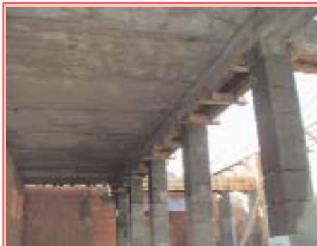
Födém került fölénk