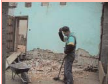
"Hát ez sosem fogy el!"